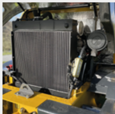
Leicht zu reinigendes Kühlerpaket