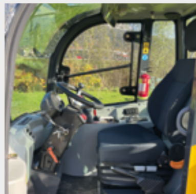
Komfort-Sitz mit beheizter Kabine