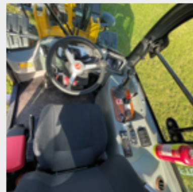
Kabine mit sehr guter Rund-um-Sicht