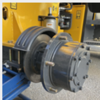
Achsen mit Endantrieb