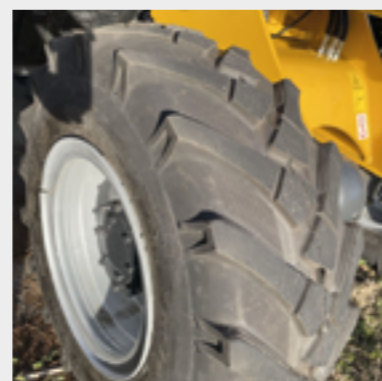
Serie: 20.5/70-16 Agrar-Bereifung Optional: 16/55-17 (siehe Titelbild)

Stand Dezember 2022 • Irrtümer und Änderungen sind vorbehalten