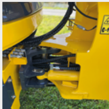
Knickpendelgelenk für mehr Flexibilität und Bodenhaftung